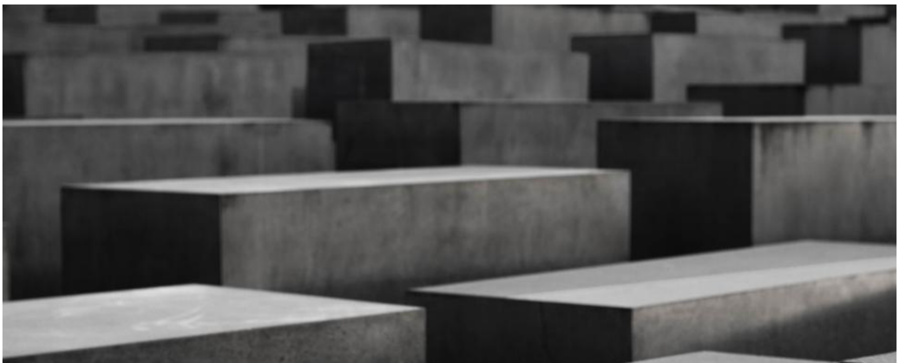
Das Holocaust-Mahnmal Berlin

Die zweifelsfrei abscheulichste Ausformung des rassistischen Antisemitismus in Deutschland folgte im 20. Jahrhundert mit der Shoa.